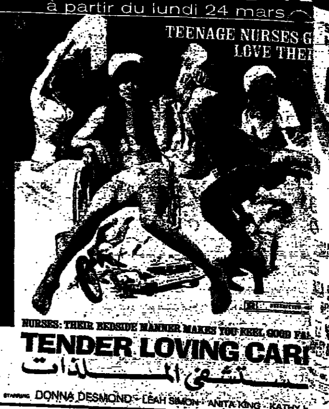
VERSAILLES - ROX